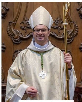
Invitation à prier pour notre nouvel évêque