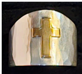
l'anneau épiscopal offert par le diocèse à son nouvel évêque.